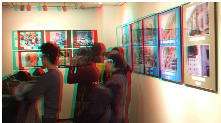
アナグリフプリントの展示の様子

2014年12月5日から10日まで、神戸三宮駅近くのギャラリー葉月で3D写真展「飛び出し Masse! 2014」を開きました。今回の写真展には、アナグリフA3プリント38点と3Dテレビによる3Dスライドショーおよび3Dビデオ作品が出品されました。来場者は推定200人を超えました。なかには、通りすがりにポスターを見て入ったという人もいて、神戸市民の芸術への関心の高さをうかがわせました。